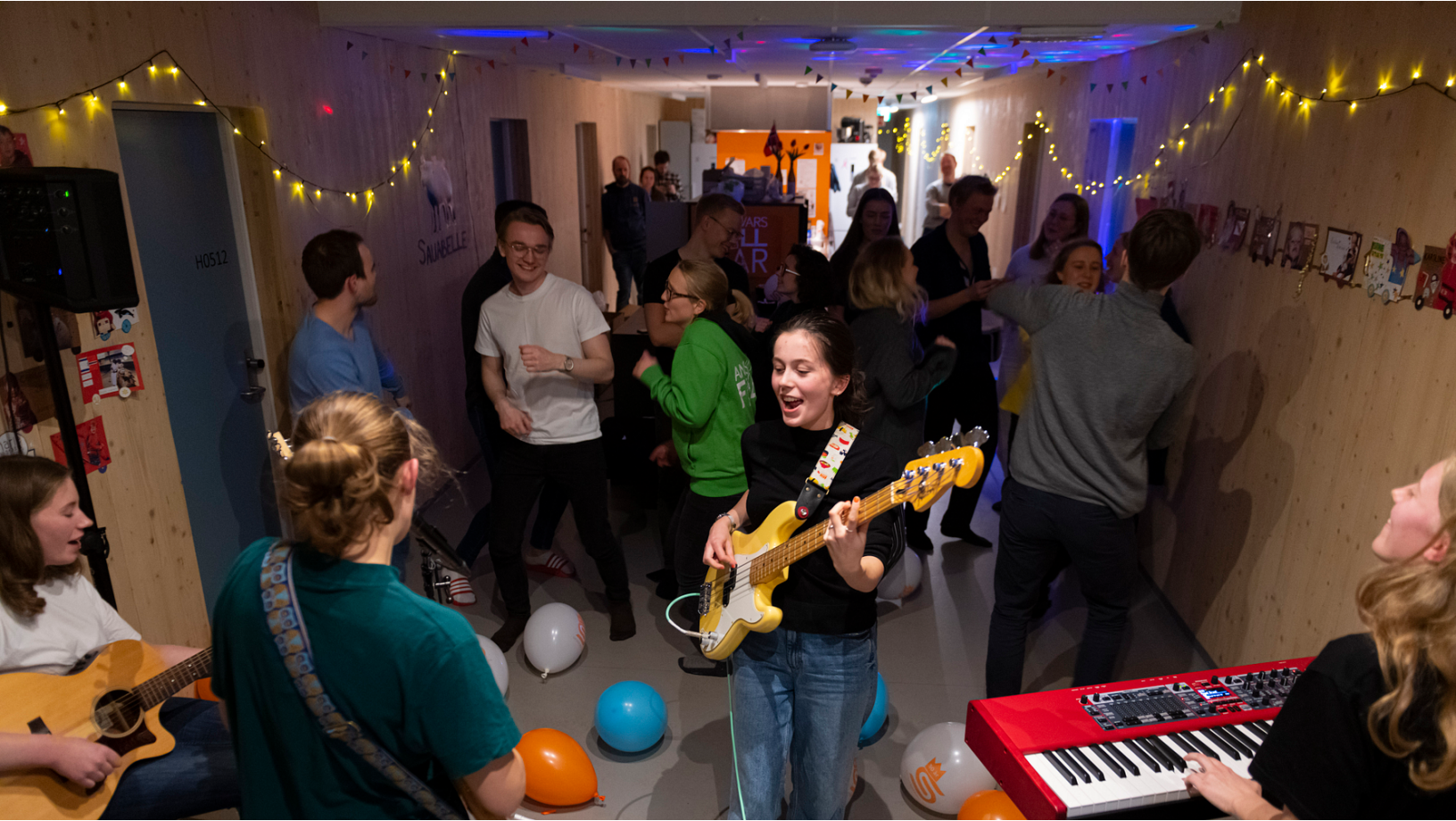
A Million Pineapples spiller for Panorama Drama