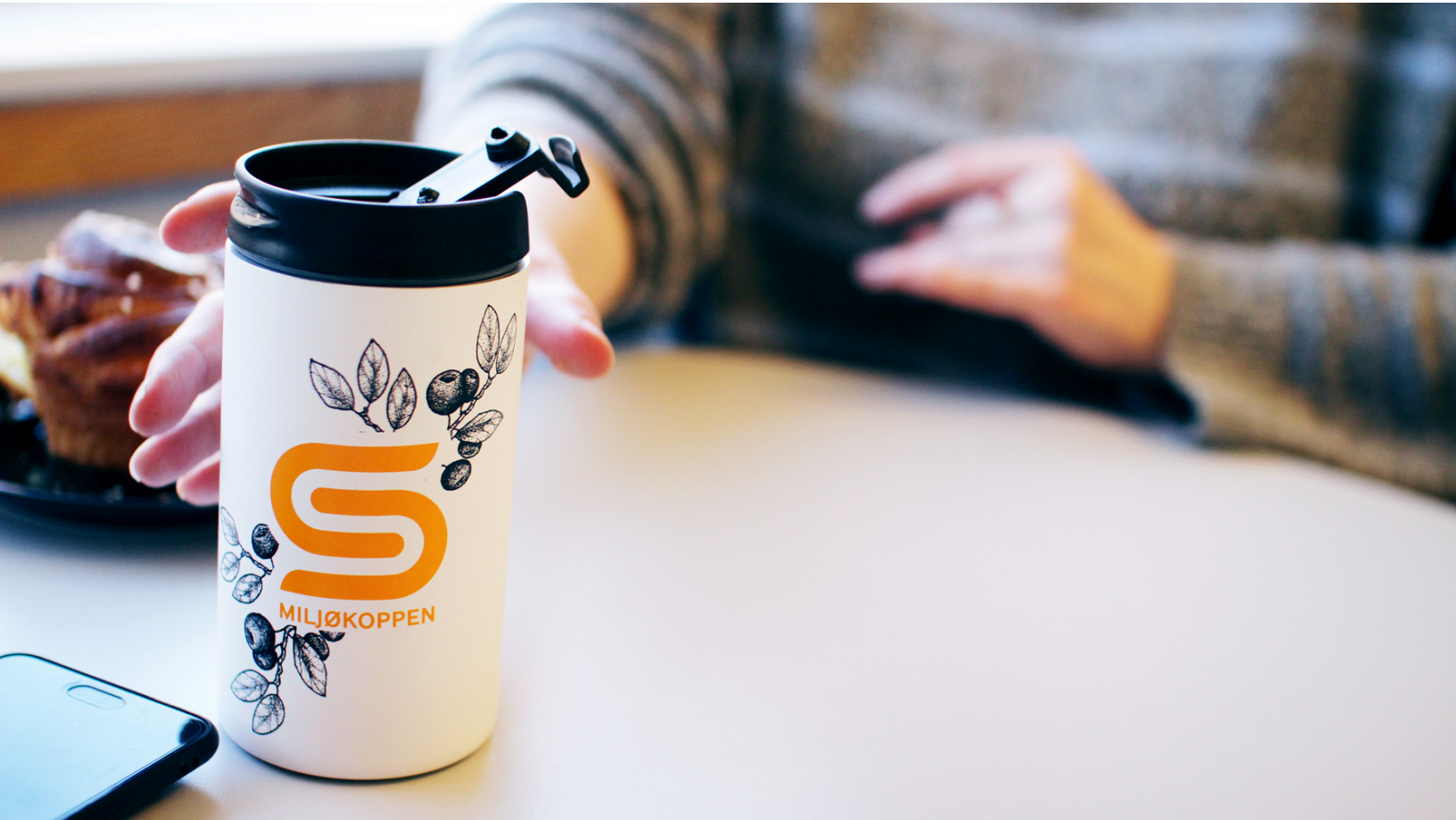
Samskipnadens miljøkopp.